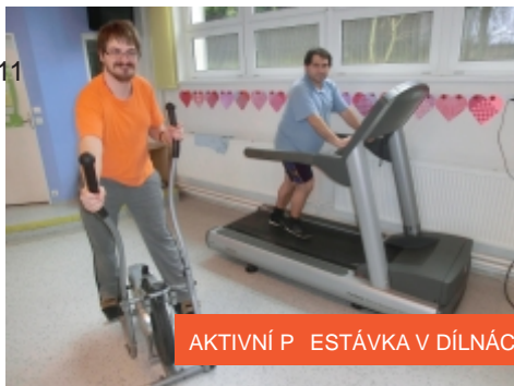
AKTIVNÍ PŘESTÁVKA V DÍLNÁCH