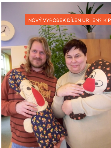
NOVÝ VÝROBEK DÍLEN URČENÝ K PRODEJI NA ZŠ BRUMOV