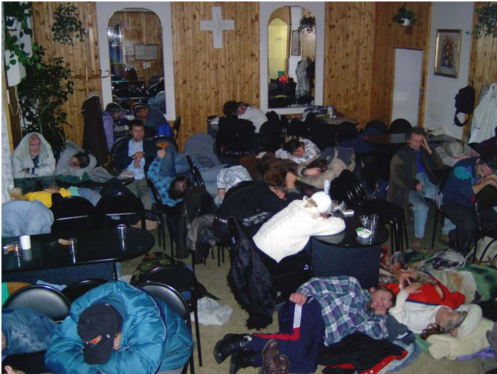
Zima je postrachem bezdomovců. Nedostatek ubytovacích míst se projevuje v plné síle. Také denní centra, jako toto v Praze u hlavního nádraží, bývají vyhledávána jako noční útulek.